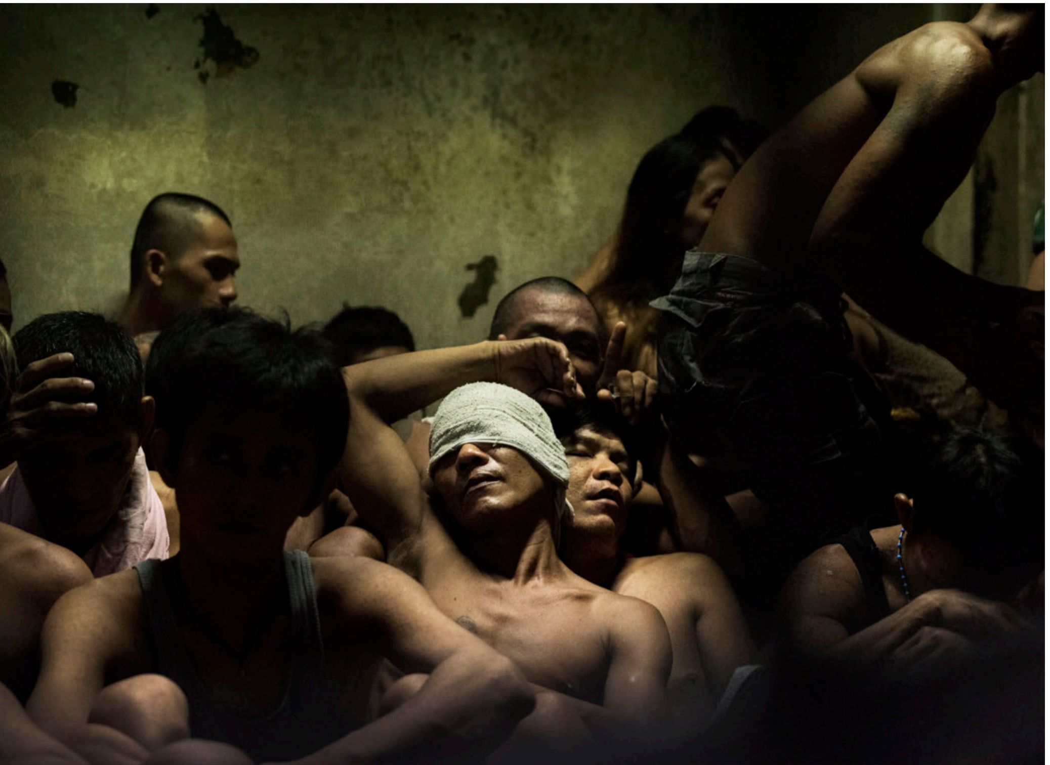
De filippinske fængsler er overfyldte, især efter præsidentens erklærede krig mod narko. Her sidder 70 mennesker stuvet sammen i en celle med plads til 40 i Manila.

ekstrem fattigdom. Dvs. at de ikke har råd til tre måltider om dagen.